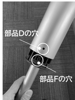
図④ - ①② 組み合わせ時注意